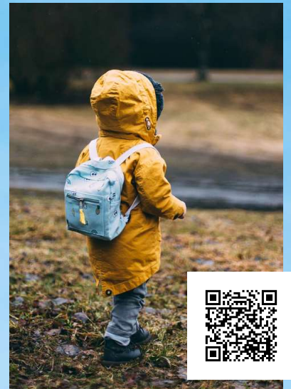
UNDP Sweden, Jag är en siffra att räkna med, https://www.youtube.com/watch?v=cB4bx3kJl50

I Lärarförbundets ranking 2019 placerade Båstads kommun sig på femte plats i riket och på första plats i Skåne. Till grund för rankingen ligger tio kriterier som är viktiga för att bedöma skolans förutsättningar och resultat. Östra Karups skola, här bredvid målstoppen, vann priset "Årets arbetsplats i Båstads kommun" 2019.