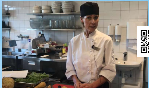
Båstads kommun, Hållbarhetsveckan 2020 Mål 2, https://youtu.be/M837Z1aQB8