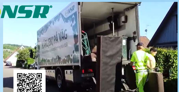
NSR, Nya återvinningstjänster i Båstad, https://www.youtube.com/watch?v=4Vs5Z25TnNc