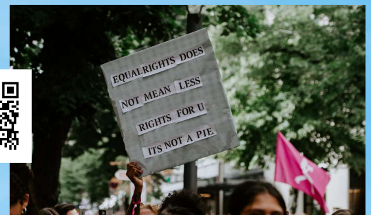
Nobel Prize Museum, Mål 10, https://www.youtube.com/watch?v=IXxy6v8Oo4