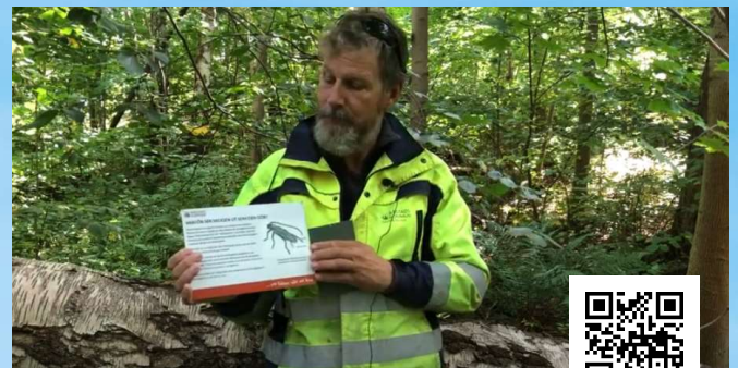
Båstads kommun, Hållbarhetsveckan 2020 Mål 15, https://youtu.be/1_QkrVZA3_A